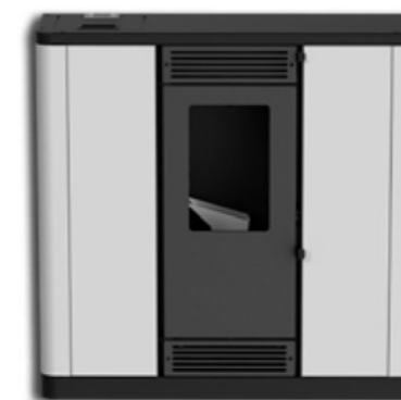
WHITE / IVORY RAL9003 / RAL1015