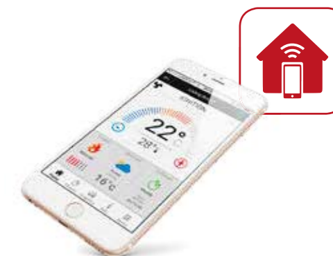
REMOTE MANAGEMENT SYSTEM